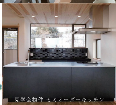
見学会物件 セミオーダーキッチン