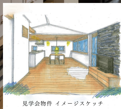
見学会物件 イメージスケッチ